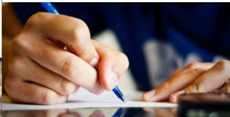
График приема заявителей в прокуратуре Пермского края по адресу:

г. Пермь, ул. Луначарского, 60 в каб. 101 Прием ведется ежедневно помощниками прокурора края с 9-00 до 18-00, в пятницу с 9.00 до 17.00 перерыв с 13.00 до 14.00