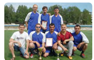
команда «Север» 1 место

Руководство прокуратуры края выражает благодарность всем участникам и болельщикам соревнований, поздравляет всех