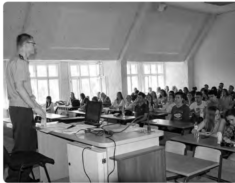
Студенты философско-социологического факультета Пермского Государственного научно-исследовательского института

Старший помощник прокурора края по взаимодействию со СМИ и Управление общественных связей ПГНИУ, Кунгурская городская прокуратура