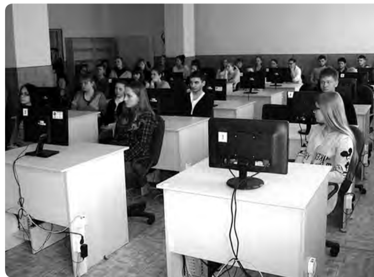
Кунгурский многопрофильный техникум