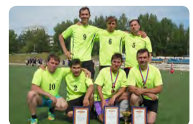
команда «Аппарат» 2 место