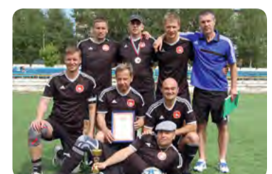
команда «Судьи» 3 место

победителей и призеров турнира с заслуженной победой, и желает всем новых завоеваний и достойных спортивных побед!