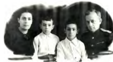
С семьей, 1948 г.