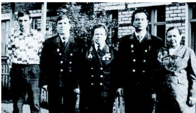
Коллектив прокуратуры Бардымского района 1982 год

Коллектив прокуратуры Бардымского района